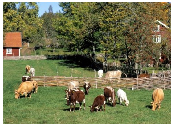
Bild: Weidepflicht für Rinder und Schafe fördert die Gesundheit der Tiere und bewahrt artenreiche Kulturlandschaften.